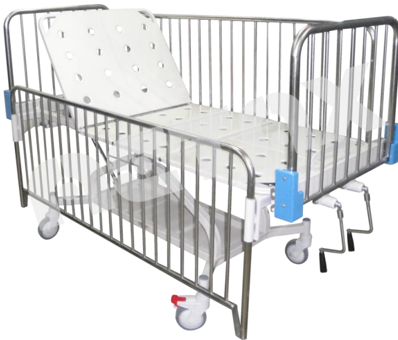
CUNA CAMILLA CON SISTEMA TRENDELEMBURGO 1700MM (Imagen Referencial)